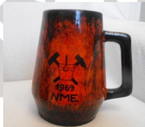
2. kép: Az első kohász (gyűrűalapító) sörös kupa

A kupa formájában alkalmazási trükköt véltünk felfedezni, ami tréfának jó lehet, de elronthat egy ünnepélyes estét. A kupa anyagának választottuk a kerámiát, és megterveztük a kupaformát. A Bodrogkeresztúri Kerámia Gyárban megrendeltünk 112 db kohász sörös kupát, rajta az éppen formálódó kari jelvény és az 1969-es évszám (2. kép).