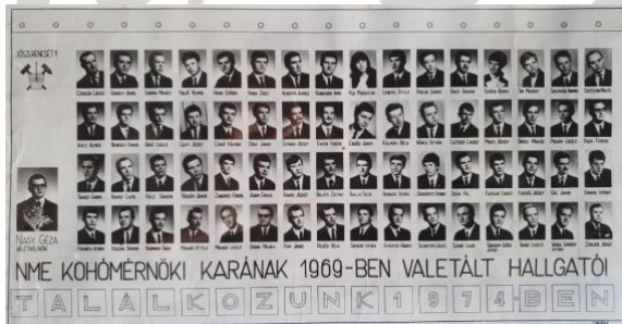
5. kép: Az 1969-ben végzett nappali tagozatos kohász hallgatók

Ez tökéletesen alkalmas lenne egy családfa kiinduló törzs-gyűjtemény megjelenítésére. Sőt, szolgálhatná a bányász, kohász, erdész alapító karok megszokott és megszeretett, napjainkig működő főágak eredeti neveit. Folytatva a hallgatói kronológiát, időközben a diplomák elkészültek és a védések pozitív kimenetele is sejthető volt. Így megállapítható volt a friss diplomások kiléte és elkészülhetett a tabló is (5. kép).