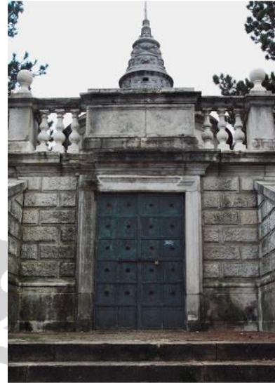
A kilátó hátoldala, még díszkút életében a kútkezelő bejárata volt