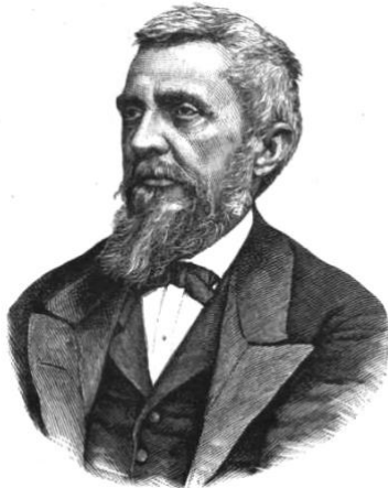
ZSIGMONDY VILMOS.