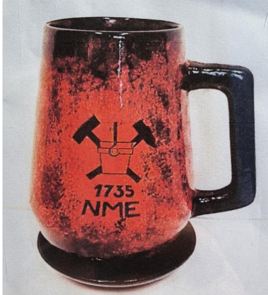
3. kép: Az első kohász egyetemi kupa másik oldala: a Selmecebányai Bányászati Akadémia alapítása évének emlékére

Erre a kupára a Selmecebányai Bányászati Akadémia alapítási éve, 1735 volt ráégetve (3. kép).