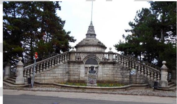
A Széchenyi kilátó szemből, a Rege út felől nézve a Svábhegyen 2020 decemberében

15.) bányamérnök születésének 200-dik és gróf Széchenyi István a „legnagyobb magyar” (Bécs, 1791. szeptember 21.) születésének 230-dik évfordulójára.