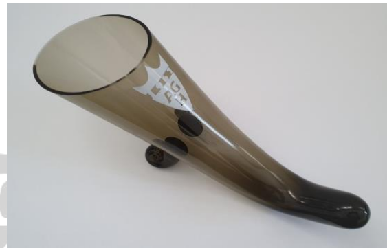
1.kép: Krakkói üveg kupa 1967. dec. 3.

megismertük az AGH jubileumi üvegcupáját, ami megtetszett (1. kép).