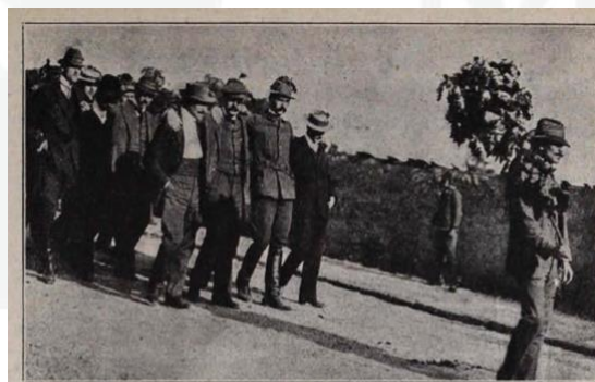
»Ballagás«. A selmecebányai m. kir. erdész- és bányászati főiskola alapítása óta az a szokás, hogy a főiskolát elhagyó hallgatók oly módon búcsúznak el egymástól, hogy összeülkezve ballagnak. Legelől a legöregebb erdészhallgató viszi a cserfagalyakból készült jelvényt, utána ölelkezve a többiek. Képünk az idén végzett diákok hagyományos »ballagását« ábrázolja.

Ebben a világjárványos, karanténos időszakban mi is reménykedjünk egy nem túl távoli jövőbeni – sőt, mihamarabbi – selmecebányai boldog viszontlátásban!